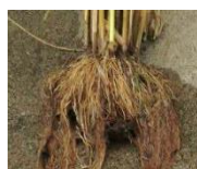
根の状況 乳酸菌なし

また、稲の根張りが良くなり、丈夫で健康に育つため、倒伏の被害を軽減する効果が期待できます。