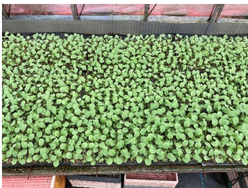
【葉面散布後の状況】